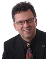
Clemens Körner Landrat Rhein-Pfalz-Kreis